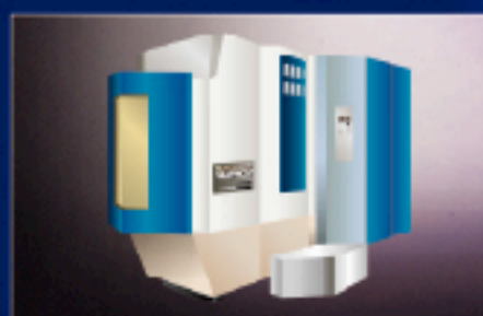
■ 工作機 クランプ作用