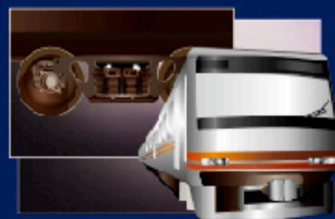
■ 電車 ブレーキ作用