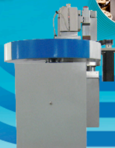
■サーボモータ+マイクロポンプユニット