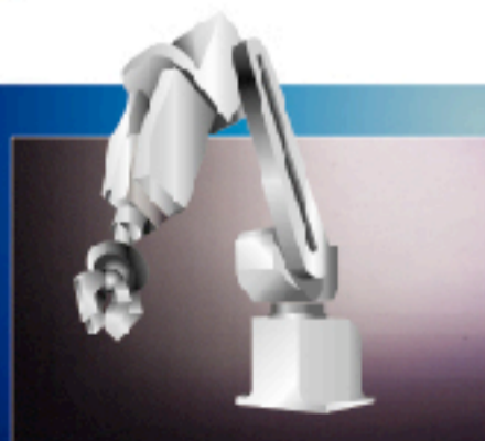
■ ロボットアーム クランプ作用