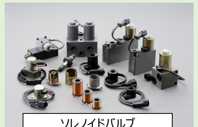
ソレノイドバルブ