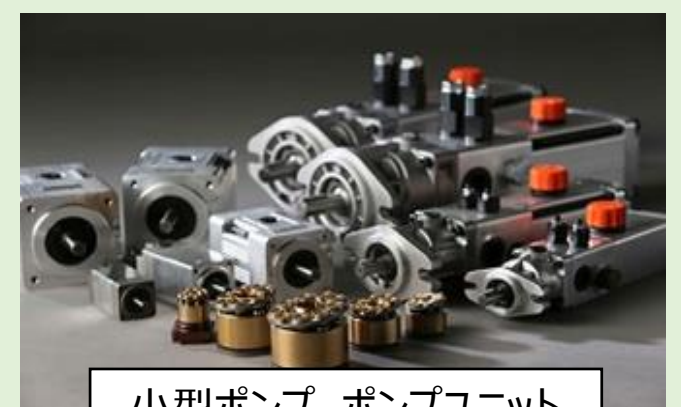
小型ポンプ、ポンプユニット